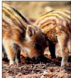
Zum Frischlingsfest lädt der Erlebniswald Trappenkamp für morgen ein.